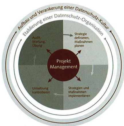
Das Intargia Datenschutzmanagementsystem

Basierend auf den Ergebnissen des Audits wurde gemeinsam mit Eintracht Frankfurt eine Datenschutzstrategie entwickelt und umzusetzende, geeignete technische und organisatorische Maßnahmen wurden abgeleitet. Neben technischen Maßnahmen aus dem Bereich IT- und Informationssicherheit gehören auch organisatorische Maßnahmen zu einem wirksamen Datenschutz: Etablierung der Datenschutzorganisation, Festlegung der Verantwortlichkeit für Datenschutz im Unternehmen, Schulungs- und Sensibilisierungsmaßnahmen für die Mitarbeiter, die Erstellung und Veröffentlichung des Datenschutzhandbuchs, die Sicherstellung der datenschutzkonformen Entsorgung von Datenträgern und Papiermüll oder das Anlegen der vom Gesetzgeber geforderten Verfahrensverzeichnisse. Alle diese Maßnahmen wurden in dieser Phase geplant und die einzelnen Schritte priorisiert. Abschließend wurde gemeinsam ein Zeitplan erarbeitet und die Durchlaufzeit für zukünftige Auditzyklen festgelegt.